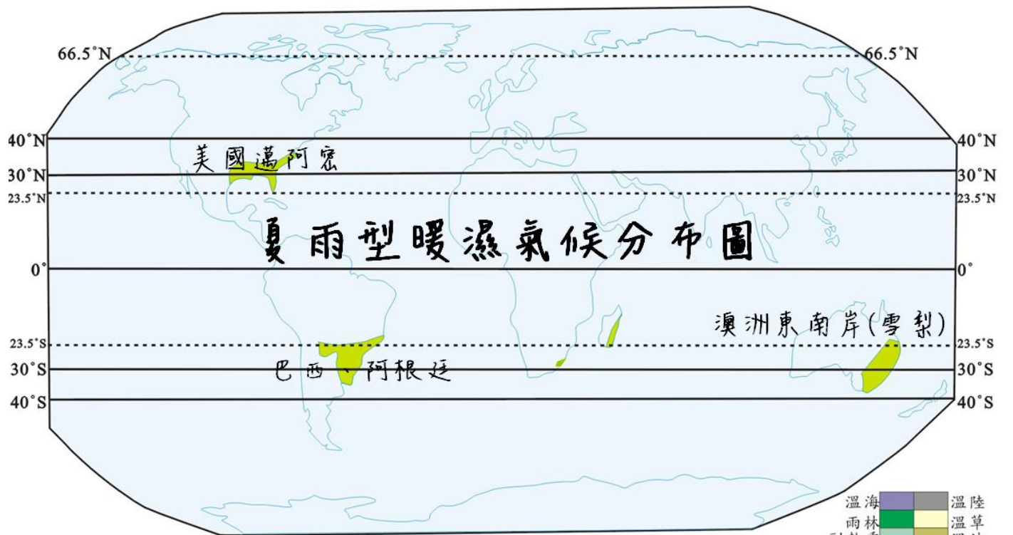
世界氣候分區圖 吳正宇老師製