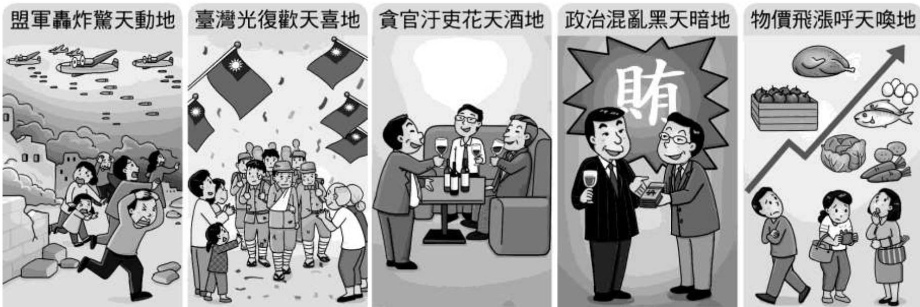
▲圖2 諷刺戰後初期臺灣「五天五地」的想像圖